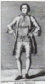
(Hanna(h) Snell, gravure uit haar biografie, 1750